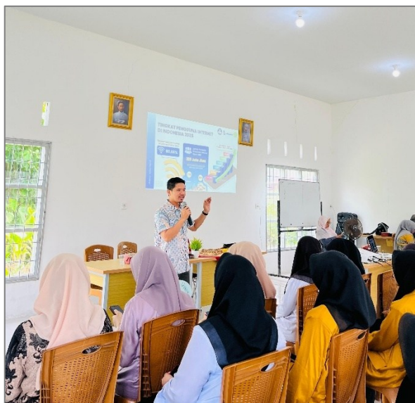
Gambar 2. Suasana Kegiatan

Selama pelaksanaan edukasi dan sosialisasi, peserta menunjukkan keterlibatan aktif dalam diskusi dan sesi tanya jawab. Hasil pengamatan dan diskusi menunjukkan bahwa mayoritas siswa menggunakan media sosial terutama untuk hiburan dan interaksi cepat, sementara praktik verifikasi informasi, pengendalian emosi saat berkomentar, dan kesadaran privasi masih bervariasi. Pola ini sejalan dengan gambaran penggunaan internet kelompok muda yang cenderung dominan untuk hiburan dan media sosial (Ramadani et al., 2024). Selain itu, beberapa siswa secara terbuka mengakui pernah menyaksikan atau terlibat dalam penyebaran konten konflik dan perundungan yang direkam serta dibagikan melalui media sosial yang kemudian memicu dampak sosial lebih luas. Kondisi ini menegaskan bahwa persoalan etika digital merupakan masalah nyata di kalangan pelajar, meskipun mereka telah terbiasa menggunakan teknologi digital.